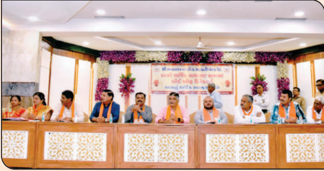
બેંકની ૬૬ મી વાર્ષિક સાધારણ સભામાં ચૂંટણીનું પરિણામ જાહેર થતાં પ્રચંડ બહુમતિથી સભાસદો દ્વારા ચૂંટાઈને આવેલ ડીરેક્ટરશ્રીઓ.