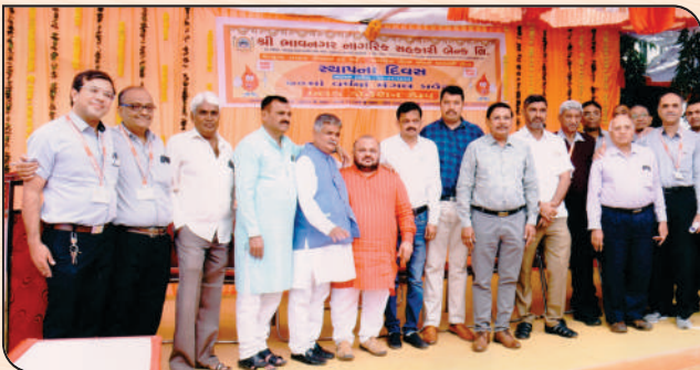
બેંકના કમર્ચારીઓ સાથે બેંકનાં ડિરેક્ટરશ્રીઓ