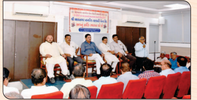
બેંકના કર્મચારીઓ સાથેની મિટિંગમાં ઉપસ્થિત બેંકના ડીરેક્ટરશ્રીઓ.