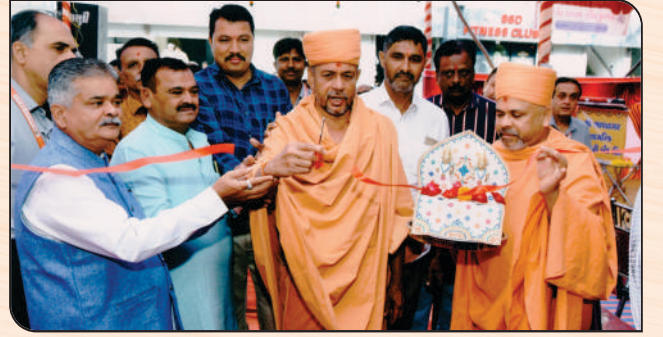
બેંકના સ્થાપના દિવસે અક્ષરવાડીના પૂજ્ય સ્વામીજી સાથે બોર્ડ ઓફ ડિરેક્ટરશ્રીઓ, હોદ્દેદારો તથા આમંત્રિત મહેમાનો.