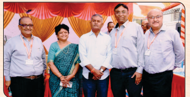
ભાવનગર મહાનગરપાલિકાનાં મેયરશ્રી, ડેપ્યુટી મેયરશ્રી તથા બેંકના અધિકારીશ્રીઓ