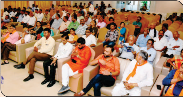
બેંકની ૬૬ મી વાર્ષિક સાધારણ સભામાં આમંત્રણને માન આપી પધારેલ શહેર ભાજપનાં હોદ્દેદારો તથા અગ્રણીઓ.